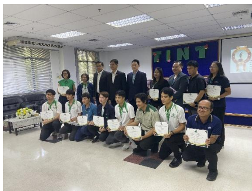
ภาพกิจกรรมการประกาศเจตนารมณ์ No Gift Policy จากการปฏิบัติหน้าที่